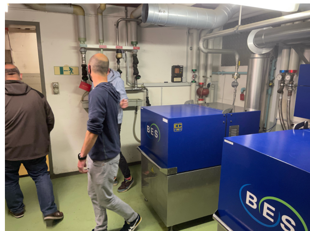
Installations de production énergétique