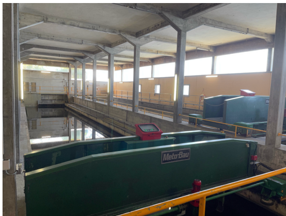
Bassins de décantation