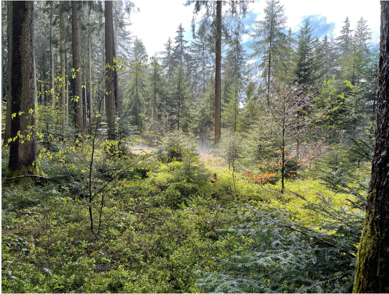
Rajeunissement forestier naturel avec un minimum d'intervention humaine