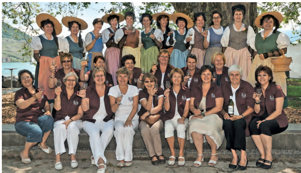
Les vigneronnes de Lavaux lors de l'amicale organisée par notre groupe à Cully en 2012.

Durant tout l'hiver, elles se retrouvent pour des rencontres culturelles, sportives, artistiques et amicales.