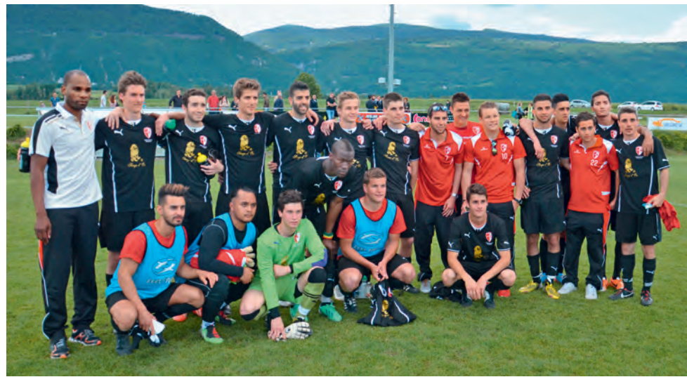
Finale de coupe vaudoise pour Lutry II (3e ligue) contre Payerne (2e ligue), à Champvent (3:0).

Notre groupe d'athlétisme s'est rendu le dimanche 27 avril à La Sarraz pour un concours d'athlétisme. Ils se sont fort bien défendus et ont terminé la journée par 2 courses d'estafette. Certains jeunes étaient fatigués car ils avaient déjà couru la veille les 4 kilomètres de Lausanne. Le 4 mai, le groupe s'est rendu à Pully avec 17 jeunes qui se sont bien donnés tout au long de cette belle journée. Un grand merci également aux parents qui s'impliquent soit en venant voir les jeunes concourir soit en participant comme bénévoles.