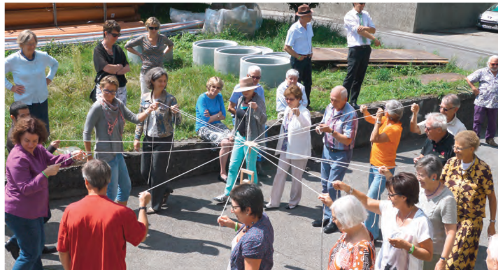
«Fête des bénévoles: quand la collaboration devient un jeu...»

Mercredi 3 décembre : Assemblée paroissiale d'automne à 20h00 (lieu à définir).