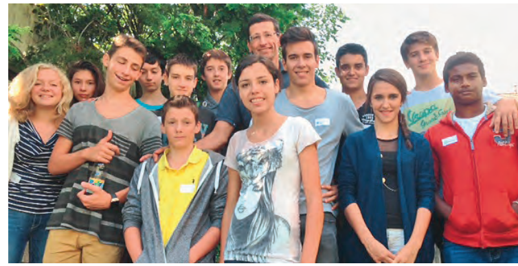
Les jeunes de nos 2 paroisses qui se sont préparés à la Confirmation.

Notre Unité pastorale l'Orient qui regroupe les paroisses de Cully, Lutry-Paudex, Pully et du