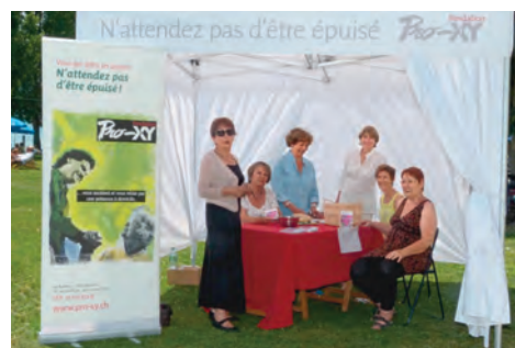
La tente Pro-XY avec une partie de l'équipe de l'antenne de Lavaux (photo B. Daout).

Vous souhaitez travailler quelques heures par mois (avec une petite rémunération) dans une activité solidaire? Vous vous occupez d'un parent ou d'un proche et souhaitez profiter d'un peu de temps libre? N'hésitez pas à vous renseigner sur www.pro-xy.ch ou à téléphoner à la coordinatrice régionale: 079 590 61 30.