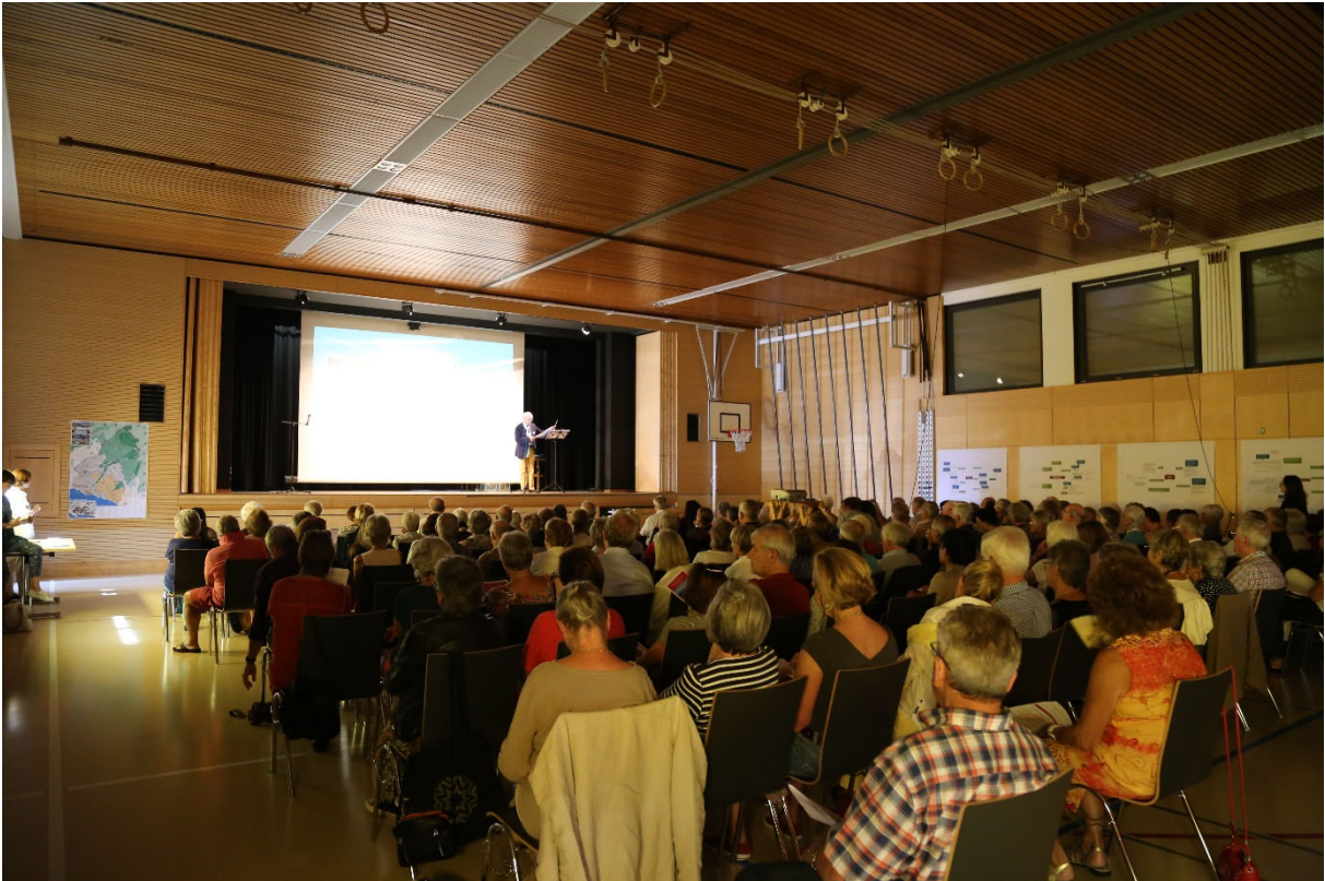
Forum du diagnostic communautaire – 8 septembre 2018