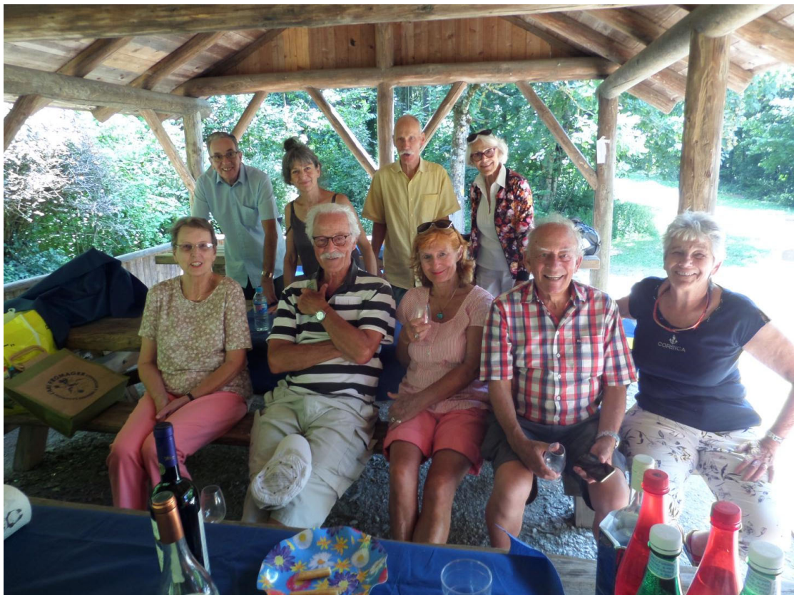
Séance du groupe habitants au vert – 28 juillet 2020