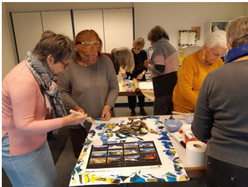
Préparation du forum – novembre 2019