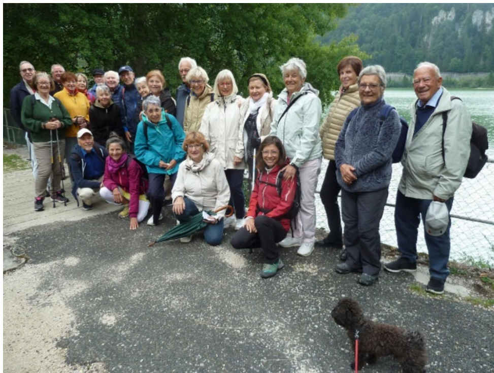
Groupe de marche au Lac des Brenets – septembre 2019