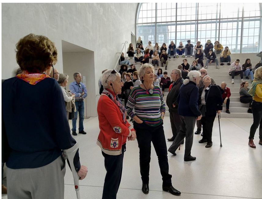
Visite culturelle – 10 janvier 2020