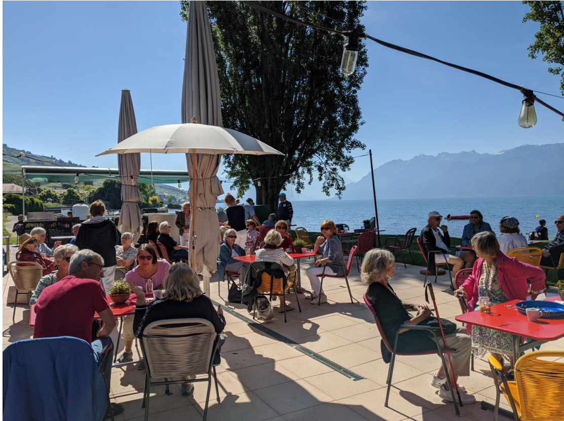
Reprise du Café-rencontre – 27 mai 2020