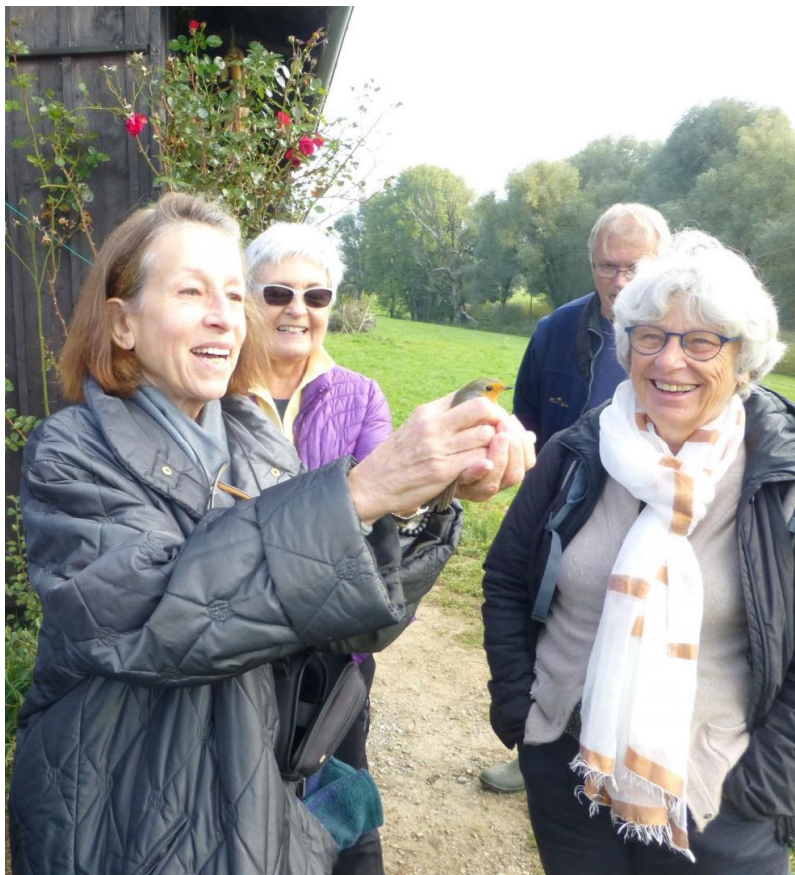
Groupe environnement : baguage d'oiseaux – octobre 2021