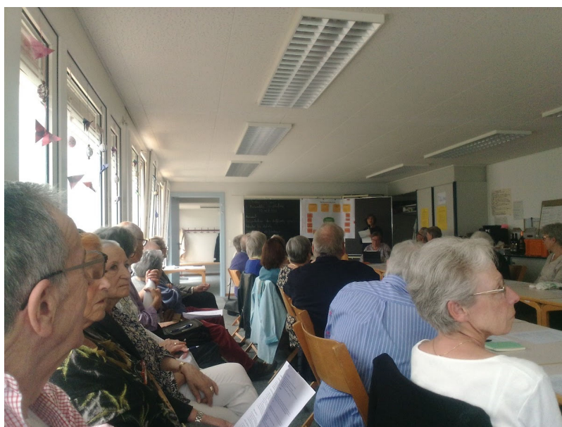
Assemblée constitutive – 29 avril 2022