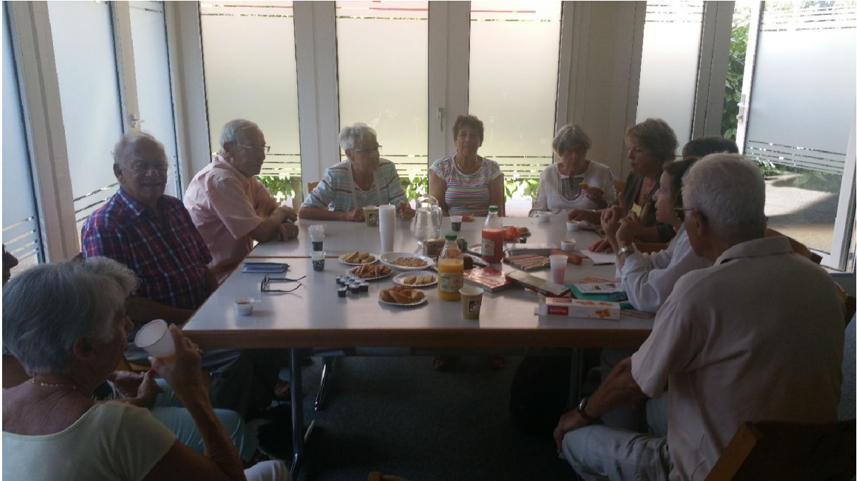
Café-rencontre à Corsy – septembre 2018